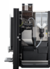
OB 3 (XL) NG