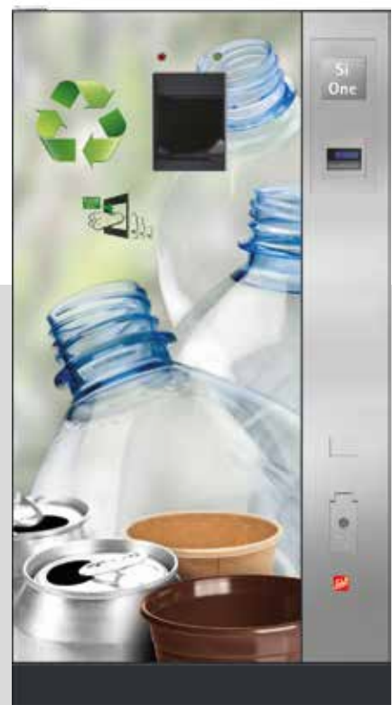
Die SiOne-Serie von Sielaff bestehend aus SiOne Small und SiOne.