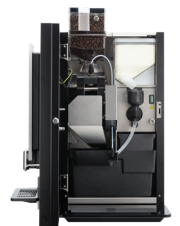
OB 2 (XL) Touch