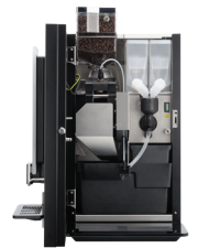
OB 3 (XL) Touch